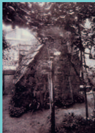
© Mensurom - XIX e siècle - Musée des Beaux-Arts de Blois

Aujourd'hui, une seule fontaine est encore alimentée par l'eau du Gouffre : la fontaine Saint-Jacques.