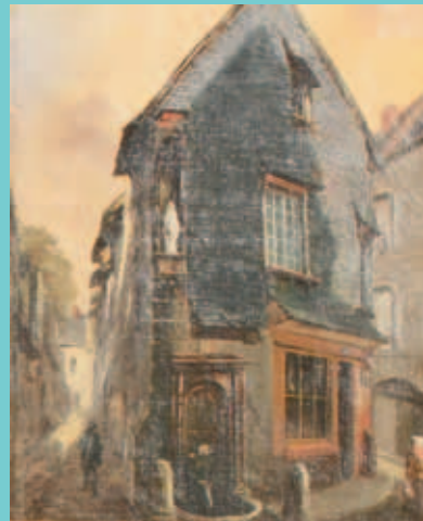
Fontaine des Élus