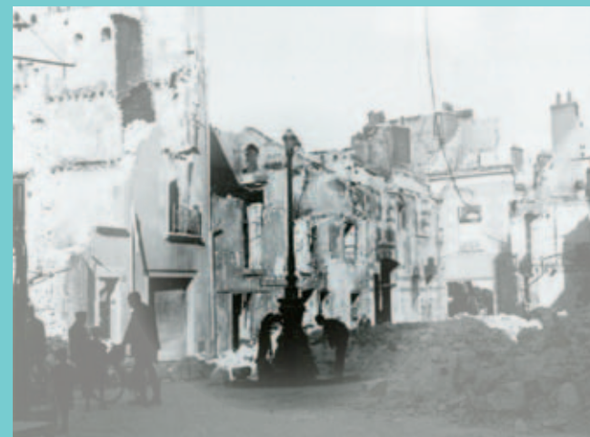
Fontaine Ave Maria

La seule fontaine encore alimentée par l'eau du gouffre.